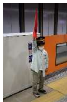
駅のお仕事体験の様子