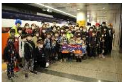
成田空港駅での記念撮影の様子